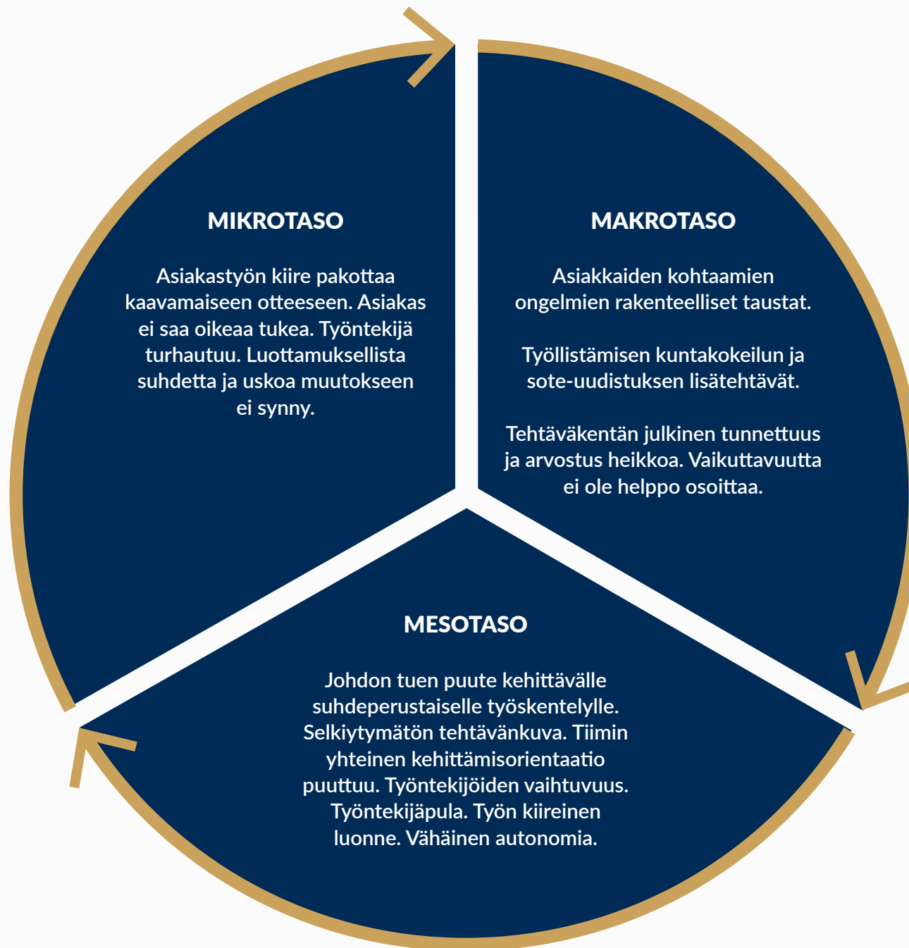
Kuvio 3 AIKUISSOSIAALITYÖN VIHელიÄINEN KIERRE